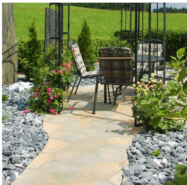
HACIENDA® CAMINOS polygonales Plattensystem