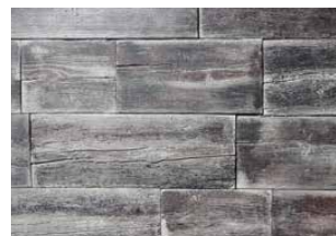
altgrau-braun (nur Gartenplatten)